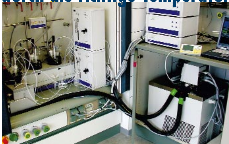
1 Gesamtsystem Syntheseautomat mit angeschlossenem Kältethermostaten Lauda RP 855

Jeder Chemiker weiß, dass die Temperatur einen großen Einfluss auf Synthesereaktionen besitzt. So führt ein Anstieg der Temperatur im Reaktionsgefäß zu einer Erhöhung der Reaktionsgeschwindigkeit. Dies hat bereits Arrhenius in umfangreichen Studien Ende des 19. Jahrhunderts entdeckt. Bei Gleichgewichtsreaktionen bedeutet dies ein schnelleres Erreichen des Gleichgewichtszustandes. Die Zeiten verkürzen sich also, bis das gewünschte Endprodukt erhalten werden kann. Auf der anderen Seite kann über die Temperatur die Produktverteilung bei chemischen Reaktionen gesteuert werden. Speziell bei organischen Synthesereaktionen laufen Parallel- und Folgereaktionen ab, die die Ausbeute am gewünschten Endprodukt stark beeinflussen können. Hier gilt es, die richtige Temperatur für eine optimale Reaktionsausbeute zu finden und wie gewünscht einstellen zu können.